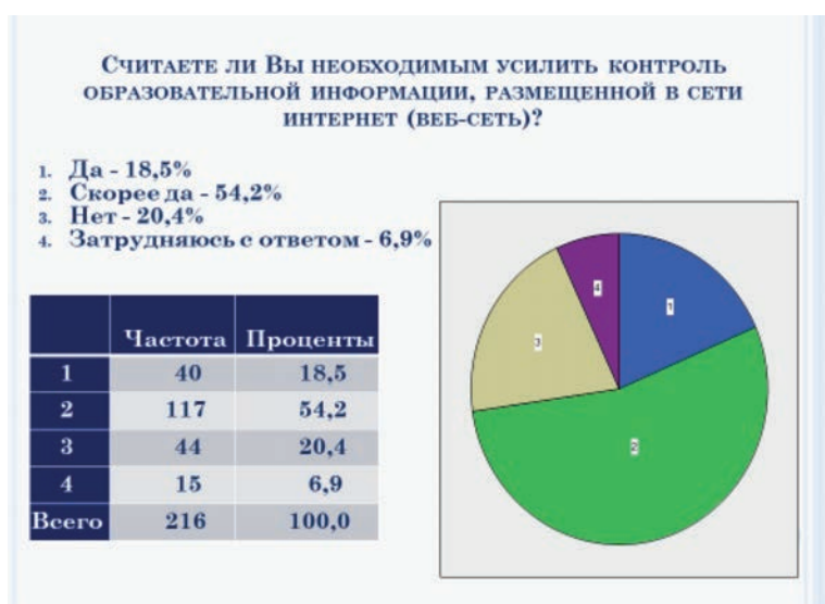
Рис. 10. Мнение экспертов о необходимости усиления контроля образовательной информации, размещенной в сети Интернет

стративного) и неформального (общественного) контроля недостоверной информации, распространяемой в СМИ с применением дистанционных технологий (рис. 10).