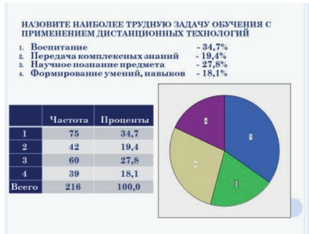
Рис. 5. Значения задач обучения сотрудников полиции с применением дистанционных технологий

нологий (электронных средств) – это воспитание и воспитанность участников образовательного процесса [подр.: 9, с. 47]. Этот вывод подтверждается результатами опроса экспертов (рис. 5).