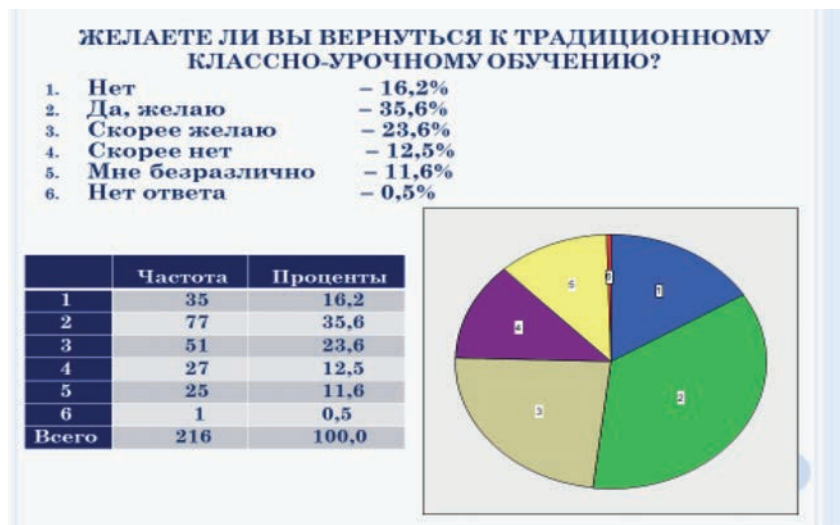
Рис. 2. Результаты опроса экспертов о перспективах традиционной классно-урочной формы обучения в вузах России

дополнительные требования к цифровой грамотности участников образовательного процесса, общественную напряженность и, как следствие, активизацию конфликтогенов. Это – объективный факт. Цифровые средства поиска, сбора, отбора, хранения, обработки, обобщения, обмена, распространения информации, как в свое время электричество, усовершенствовали средства производства, обновили (модернизировали) все сферы человеческой деятельности, в том числе и образование. Но все новое вызывает у людей опасение, что обуславливает активизацию конфликтогена, содержанием которого является противоречие между традицией и инновацией. Например, результаты исследования показывают, что 59,2% экспертов желали бы вернуться к традиционному обучению (рис. 2).