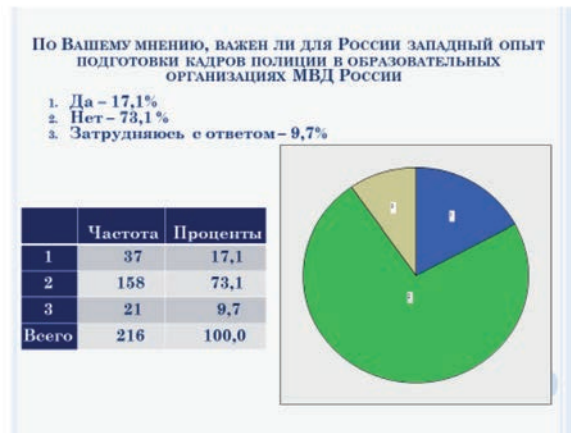
Рис. 8. Мнение экспертов о необходимости западного опыта в системе подготовки кадров полиции в образовательных организациях МВД России

Заимствование западного опыта с единым государственным экзаменом уже привело к снижению уровня знаний у современной российской молодежи, что является опасным управленческим конфликтогеном, так как ее представители уже сейчас начали массово присутствовать в органах власти.