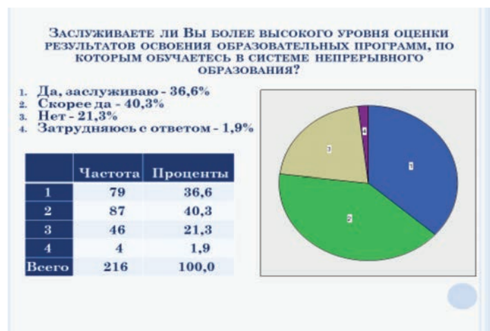
Рис. 6. Отношение сотрудников полиции к результатам оценки освоения ими образовательных программ в системе непрерывного образования

внешней оценкой их труда и самооценкой. Опросы экспертов показывают, что у обучающихся в системе непрерывного образования сотрудников полиции возрос уровень самооценки уровня своей общей профессиональной подготовки и они стали в большей степени критичны к оценке их труда преподавателя (рис. 6).