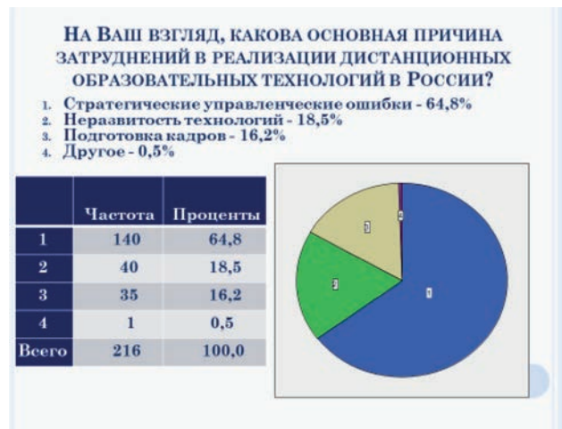
Рис. 4. Причины затруднений в реализации дистанционных технологий в России

Результаты наблюдения общественной практики показывают ошибочное мнение по поводу скорого упразднения классической классно-урочной системы обучения, то есть тенденция к реализации обучения без использования многовекового опыта – это конфликтоген. Здесь возможно лишь изменение средств, мест, интенсивности обучения. Например, классная аудитория может быть создана виртуально, где она будет представлять собой рабочие кабинеты обучающихся. Ими могут быть комнаты в квартирах, помещения библиотек, служебные кабинеты, камеры в местах лишения свободы и т.п. А непосредственное взаимодействие с преподавателем обеспечивается традиционными педагогическими технологиями, реализуемыми цифровыми средствами передачи информации. Они позволяют постоянно находиться в режиме беседы, диалога с кем-либо (так называемым биологическим преподавателем) или чем-либо (например, обучающим роботом). Таким образом, здесь участники образовательного процесса будут взаимодействовать также, как и два с половиной тысячелетия (перипатетика – Аристотель) назад. Использование электронных средств позволяет лишь совершенствовать, например, формы лекционных занятий: проблемные, визуализации, пресс-конференций и другие. Здесь аналогия