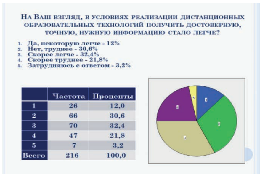
Рис. 3. Доступность информации в условиях реализации дистанционных образовательных технологий

Этот факт – явный конфликтоген, так как он вносит неравенство среди участников образовательного процесса, что в конечном итоге ограничивает их в доступе к социальным лифтам, продвижению по службе и другом передвижении в общественной стратификации.