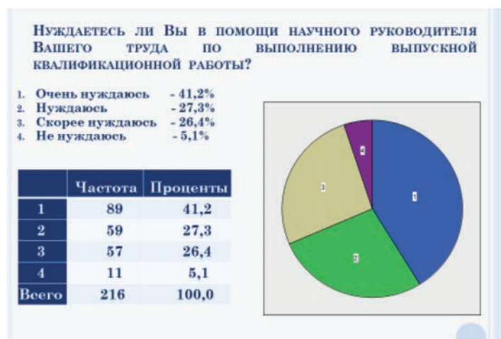
Рис. 7. Мнение экспертов о востребованности научного руководителя обучающимися в процессе выполнения выпускной квалификационной работы

обучающего субъекта) не только не снизится, а будет постоянно расти. Так, в ходе исследования был выявлен такой факт: несмотря на обилие информации, получаемой в результате развития цифровых технологий, обучающийся испытывает значительные затруднения в разработке выпускных квалификационных работ, в которых априори комплексно реализуются и оцениваются уровни решения учебной, воспитательной, научной, методической задач (рис. 7). В его деятельности возрастет значение воспитания, которое трудно формализовать, программировать, роботизировать. В результате полученные знания будут использоваться для разрушения, а не для созидания.